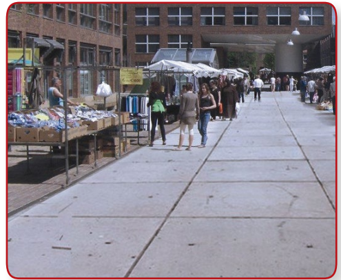
ตลาดนัด ตลาดสด

Legioplate® คือแผ่นเลโก้ที่ออกแบบสำหรับงานก่อสร้างที่ต้องใช้ในการทำงานที่รวดเร็วและในขณะเดียวกันมีความยืดหยุ่นแผ่นเลโก้สามารถจัดวางไว้อย่างง่ายดายโดยไม่ต้องใช้ปูนซีเมนต์หรือวิธีการยึดติดต่อกันอื่นๆ และยังสามารถปรับเปลี่ยนหรือขยายแผ่นพื้นเลโก้ตามความเหมาะสม รวมถึงระยะเวลาและสถานที่ โดยแผ่นพื้นเลโก้สามารถติดตั้งใช้ได้ทันทีโดยไม่ต้องเสียเวลามากมาย