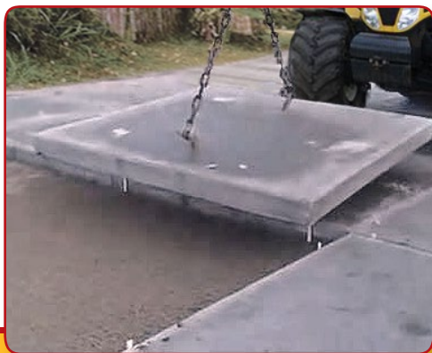
การวางแผ่นเลโก้

Legiplate® แผ่นเลโก้ใช้เวลาติดตั้งที่สั้น สามารถจัดวางโดยตรงจากรถบรรทุกดังนั้นแผ่นเลโก้จะช่วยให้คุณมีพื้นถนนคอนกรีตในเวลาเพียงไม่กี่ชั่วโมงหลังจากที่คุณเตรียมพื้นดินเสร็จแล้วถนนก็จะสามารถใช้งานได้ทันที