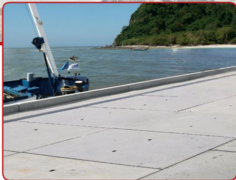
ถนนเรียบชายหาด, ท่าเรือ

Legiplate® แผ่นเลโก้เป็นทางออกที่ดีสำหรับการก่อสร้างโรงงาน, ลานจอดรถ, ถนน, ตลาดนัดตลาดสด, อาคารชั่วคราว, ถนนเส้นหลัก, ทางขึ้นจักรยาน, ช่วยอำนวยความสะดวกเพื่อซ่อมแซมถนนและอื่น ๆ อีกมากมาย