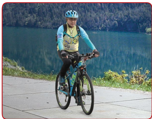
เส้นทางจักรยาน

ผลิตภัณฑ์ เจนเช่น คอนกรีต มีแพคเกจบริการที่สมบูรณ์รวมทั้งการออกแบบการคำนวณแบบโครงสร้างและขนส่งโดยการติดตั้งจากผู้เชี่ยวชาญจากประเทศฮอลแลนด์(ยุโรป) ดังนั้นเพียงแค่ติดต่อเข้ามาหาเราทางเราจะยินดีให้คำแนะนำการวิเคราะห์และคำนวณโครงการทั้งหมดของคุณ